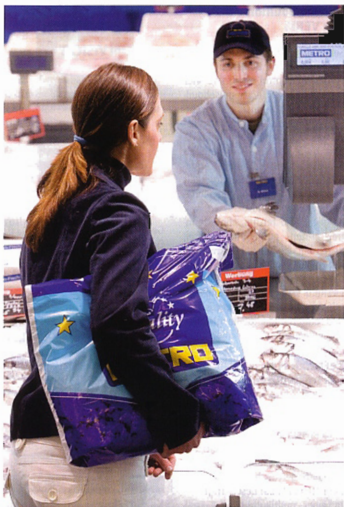
Fisch ist immer halal: Metro hat ein breites Angebot.