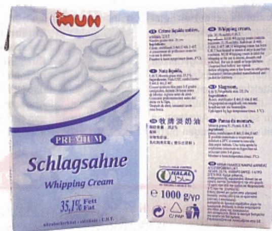
Premium-Schlagsahne in Halal-Qualität.

Das Unternehmen Zamek bietet ein Würz-Sortiment, Gazi ein komplettes Angebot aus dem Molkerei-Bereich an. Weitere Fleischspezialisten sind vor allem in den Niederlanden ansässig, aber mit deutschen Dependancen. Dazu gehört u. a. das Unternehmen Anur Halal Food, das verstärkt Fuß fassen will im Außer-Haus-Markt sowie die Tahira Halal GmbH in Hamburg, die ein Sortiment aus Fleischprodukten, orientalischen Gemüsesorten und exotischen Fruchtsäften anbietet.